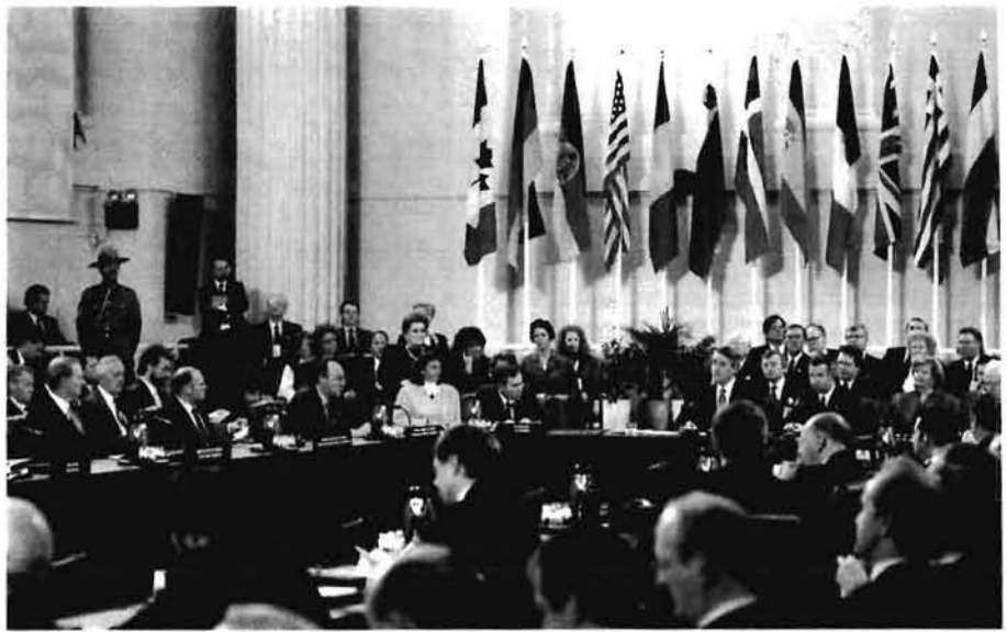
Konferenz der Außenminister von NATO und Warschauer Pakt in Ottawa 1990

nischen Gesprächspartner gegenüber ließ Marschall Ogarkow erkennen, in welchem Dilemma die Sowjetunion steckte: „In Amerika spielen selbst Kinder mit einem Computer. Aus Gründen, die Sie gut kennen, können wir Computer in unserer Gesellschaft nicht beliebig verfügbar machen. Bei modernen Waffen werden wir Euch nie einholen können, solange wir nicht eine wirtschaftliche Revolution haben. Und die Frage ist, ob wir eine wirtschaftliche Revolution ohne eine politische Revolution haben können.“ Die Antwort auf Ogarkows Frage gab der neue Generalsekretär Michail Gorbatschow, der aus dieser Konstellation die richtigen Schlüsse zu ziehen bereit war. Gorbatschow gestattete den Staaten des Warschauer Pakts endlich das lange ersehnte Mitspracherecht und wies seine militärische Führung an, ihre halsbrecherische Offensivstrategie zu revidieren. Einzig die NVA arbeitete auf alter Grundlage weiter. Noch in der Übung „Stabstraining 1989“ plante sie die Verwüstung grenznaher Landstriche Schleswig-Holsteins durch den Einsatz von 76 nuklearen Sprengköpfen.